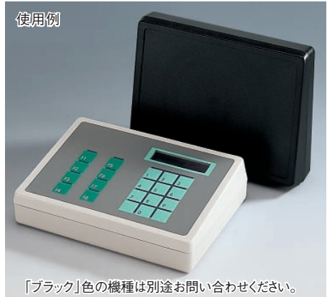
「ブラック」色の機種は別途お問い合わせください。