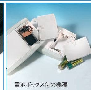
電池ボックス付の機種