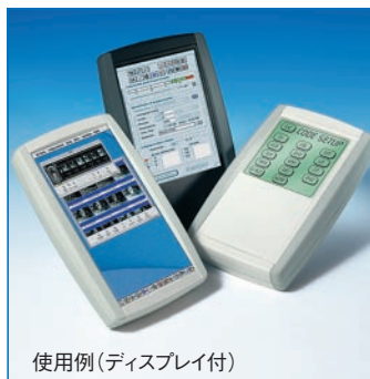
使用例(ディスプレイ付)