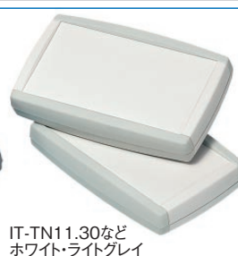
IT-TN11.30など ホワイト・ライトグレイ