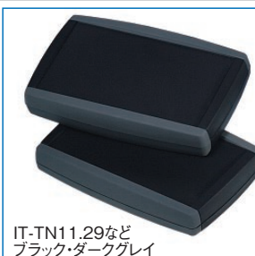
IT-TN11.29など ブラック・ダークグレイ