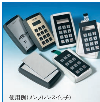
使用例(メンブレンスイッチ)