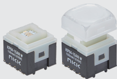
操作部ボタン装着例