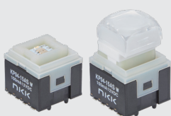
操作部ボタン装着例