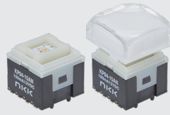
操作部ボタン装着例