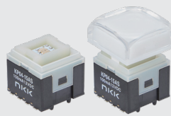
操作部ボタン装着例