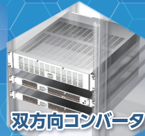
双方向コンバータ