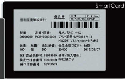
SC1029L NFCタッチで書換え可