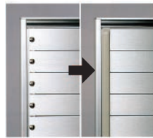
標準取付位置 19インチパネルマウント部