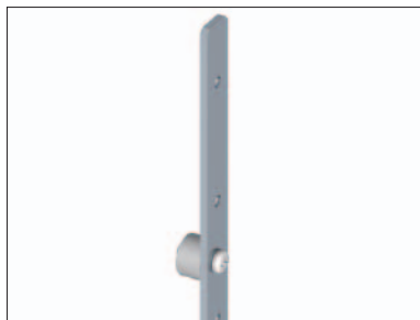
標準取付位置:サイドフレーム