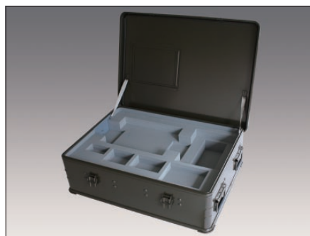
内装ウレタンフォーム例