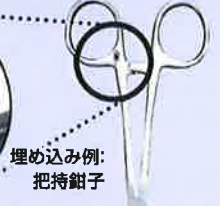
埋め込み例: 把持鉗子