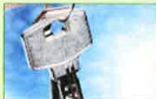
ブランドプロダクト・在庫管理など