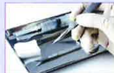
医療現場での履歴管理