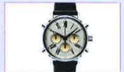
宝飾品の真偽管理