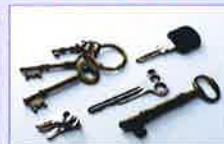
金属製品の在庫管理